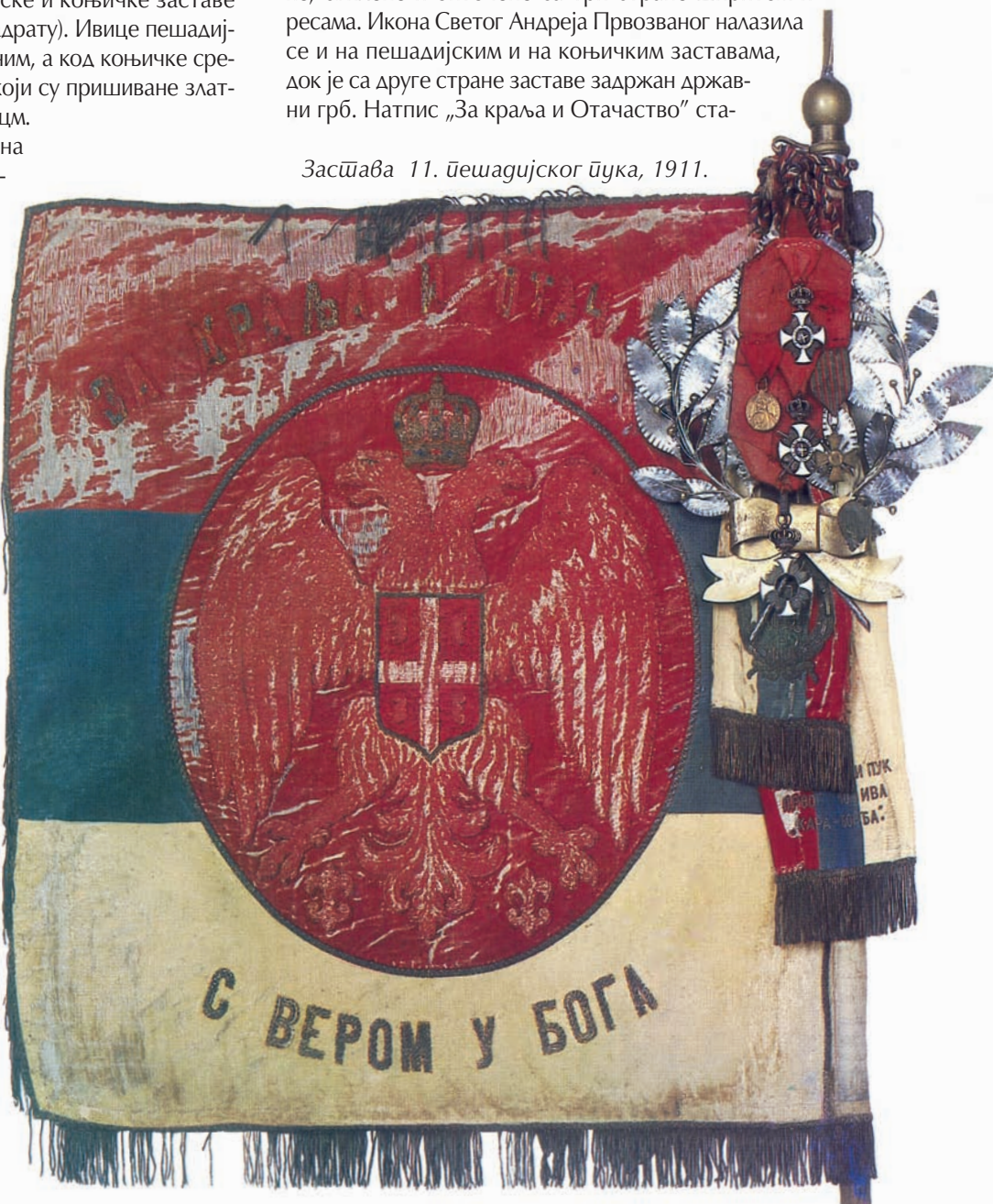
Застава 11. пешадијског пука, 1911.

Уредба о заставама није дуго важила јер је 30. новембра 1906. донета нова. За разлику од претходне уредбе, право на заставу добили су пешадијски пукови сва три позива. Гарда и коњички пукови и дивизиони добили су коњичку заставу. Значајна новина у изгледу заставе била је напуштање пурпурноцрвене боје и увођење српске тробојке. Заставе су биле димензија 75 цм у квадрату, двоструке, свилене и опточене са три стране ширитом и ресама. Икона Светог Андреја Првозваног налазила се и на пешадијским и на коњичким заставама, док је са друге стране заставе задржан државни грб. Натпис „За краља и Отачаство“ ста-