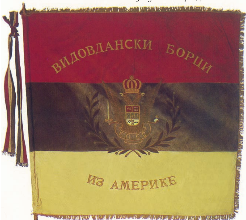
Застава видовданских бораца, 1917.

Правилима службе војске Краљевине Србије било је одређено да сви официри, заставници, војноадминистративни чиновници и војници оних команди које имају своју заставу, заклетву полажу пред својом заставом. Припадници јеврејске и муслиманске вероисповести полагали су заклетву на Талмуду, односно Курану. Војници из јединица које нису имале своју заставу, заклињали су се на заставу оне команде из истог гарнизона коју одреди командант места. Уколико у гарнизону није било заставе, регрути су се заклињали на Светом јеванђељу. На месту које је одређено