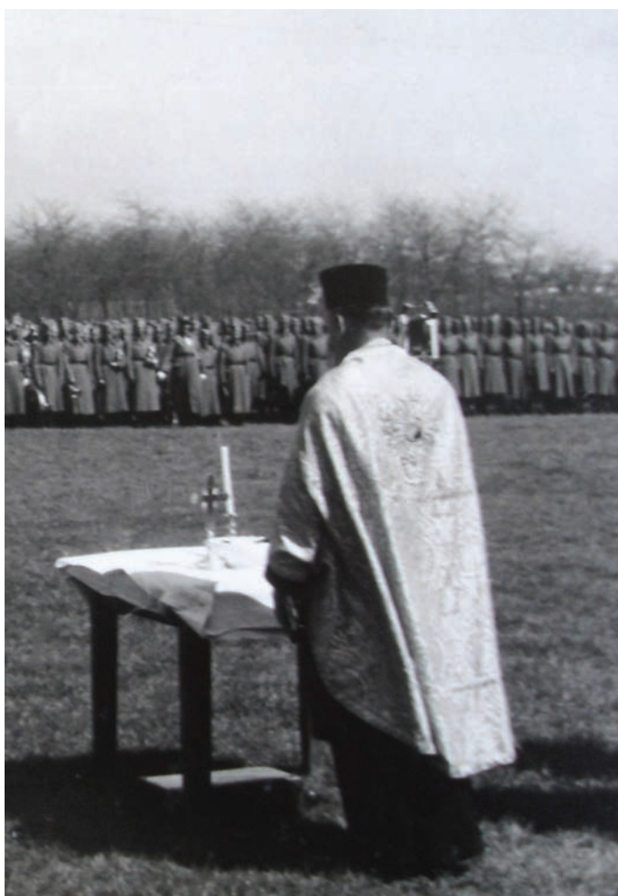
Застава 17. пешадијског пука, 1911.

Србија је за Први балкански рат у периоду од 3. до 15. октобра мобилисала 286.000 војника. Пред сам почетак Другог балканског рата у јуну 1913. у саставу српске оперативне војске било је 26 пешадијских пукова првог позива; два у саставу Моравске бригаде првог позива и четири самостална прекобројна пешадијска пука; 15 пешадијских пукова другог позива у саставу дивизија другог позива; 15 пешадијских пукова трећег позива, шест добровољачких батаљона у саставу Добровољачког одреда; 41 допунски батаљон (у сваком пешадијском пуку првог и другог позива по један); девет коњичких пукова: пет у пешадијским дивизијама првог позива и четири у саставу Коњичке дивизије; пет самосталних коњичких дивизиона у саставу дивизија другог позива. Укупно бројно стање српске оперативне војске износи-