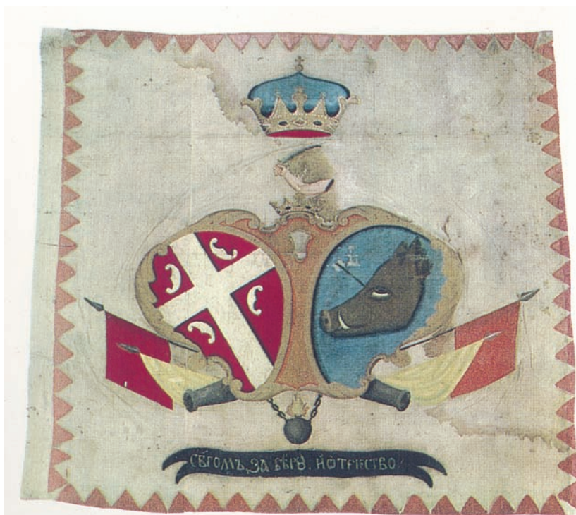
Застава регуларне устаничке војске, 1809.

Свечаност је почела у 8 часова доласком краља Александра, који је затим одао почаст старим и новим заставама. Након што су краљ, кнез Арсен, кнез Павле и министар војни заузели своја места на трибини, најпре је министар војске и морнарице генерал Стеван Хацић прочитао краљев Указ којим су додељене нове југословенске заставе свим пешадијским и коњичким пуковима, као и команди жандармерије. Након тога почео је црквени обред освећења 69 нових застава, који су извели војни свештеници православне, римокатоличке и муслиманске вере. Након верског обреда, краљ Александар говорио је о великој слави старих српских застава и значају нових југословенских застава. Указао је да су старим заставама обележене границе Краљевине Југославије и са њима је „завладао дух националног ослобођења и уједињења”. Краљ је пожело да нове заставе „буду