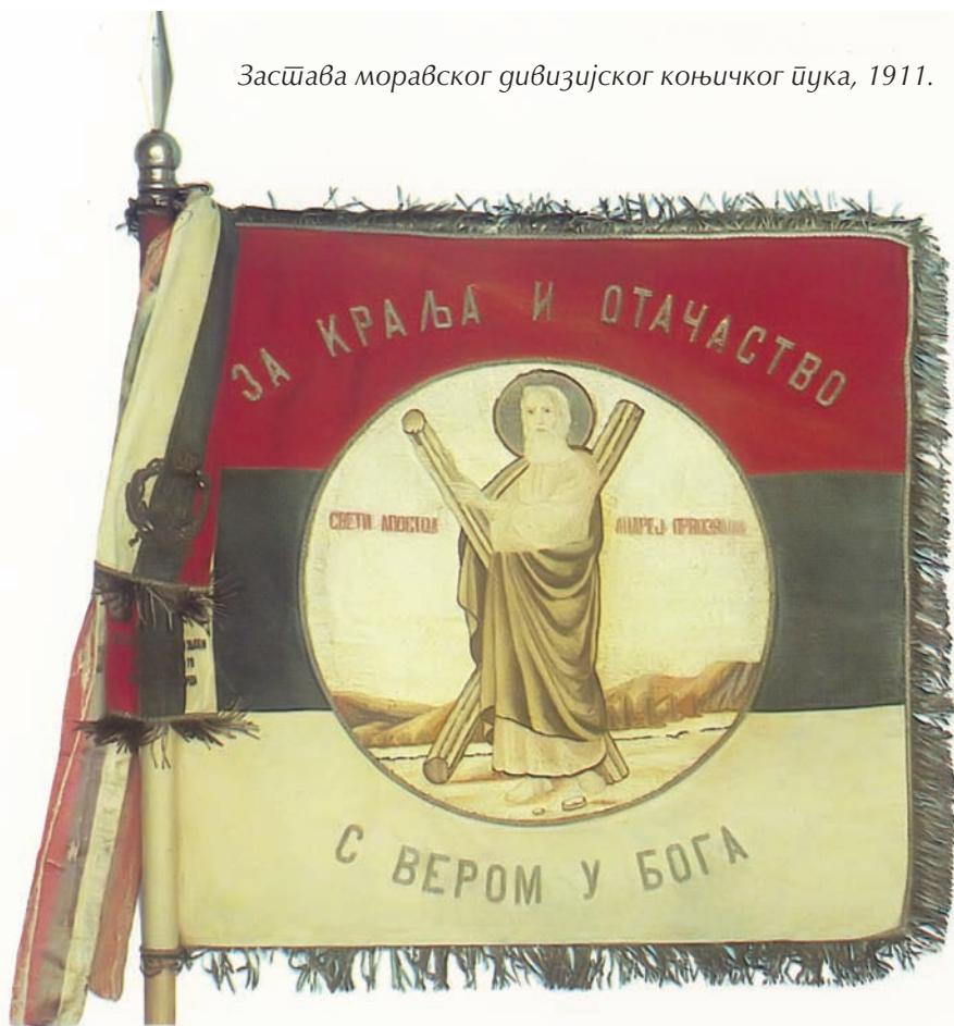
Застава моравског дивизијског коњичког пука, 1911.