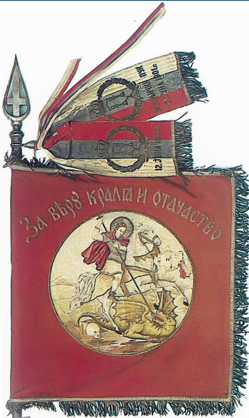
Застава коњичког пука, предња страна, 1904.

послала је у априлу 1863. године распис којим обавештава епископе да ће војска ускоро добити заставе. Препоручено је да освећење обаве „отличителни“ свештеници који су имали и задатак да војску зајачају на верност и војницима упуте неколико поучних речи. Заставе су биле тробојке, на једној страни са грбом Србије, а изнад њега полукружни натпис „За веру, слободу и отачество“. Испод грба је стајало „Михаило М. Обреновић III књаз српски 1863. год“. С друге стране заставе био је лик Св. Андреја Првозваног са натписом „За веру, слободу и отачество“. Испод лика светитеља, на белом платну, био је наведен назив батаљона чија је застава.