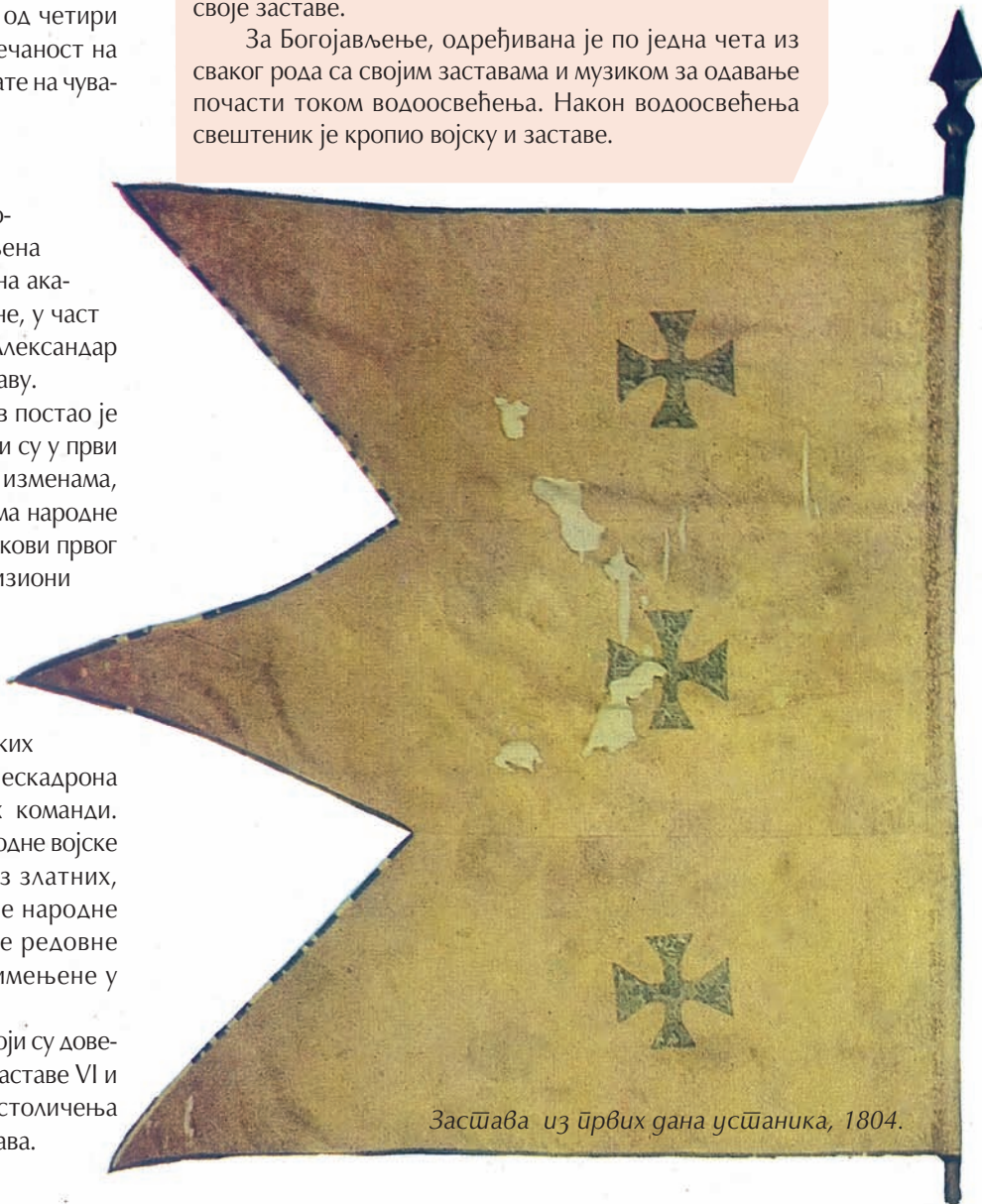
Застава из првих дана устаника, 1804.

За Богојављење, одређивана је по једна чета из сваког рода са својим заставима и музиком за одавање почести током водоосвећења. Након водоосвећења свештеник је кропио војску и зааставе.